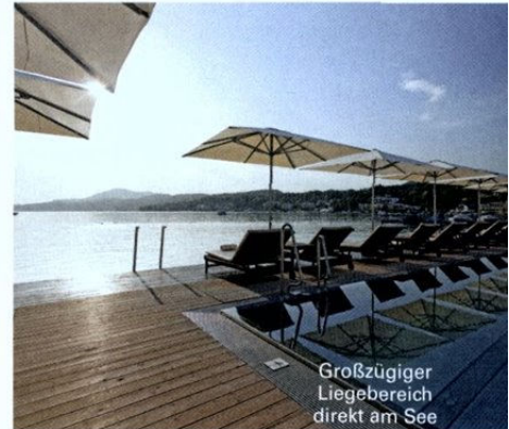
Großzügiger Liegebereich direkt am See