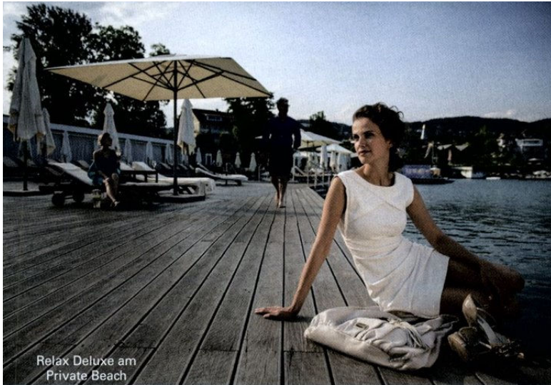
Relax Deluxe am Private Beach